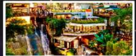
ถนนโบราณหลงเหมินฮ่าว