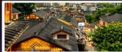
เมืองโบราณสี่ปาที้