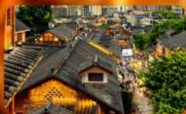
เมืองโบราณสี่ปาตี