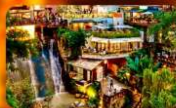
ถนนโบราณหลงเหมินฮ่าว