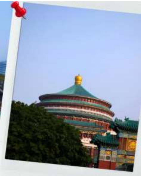
ศาลาประชาคม ท่าหลี้ถิง

จากนั้นนำท่านนั่งรถไฟฟ้าทะลุติ๊ก หรือ สถานี Liziba เป็นสถานีรถไฟฟ้าแบบขานชาลา สิ่งที่ทำให้สถานี Liziba มีชื่อเสียงไปทั่วโลกคือ “เส้นทางรถไฟที่วิ่งทะลุผ่านอาคารสูง 19 ชั้น” โดยมีระบบลดเสียงและแรงสั่นสะเทือน ทำให้ผู้ที่อาศัยอยู่ในตึกไม่ได้รับผลกระทบจากเสียงดังมาก กลายเป็นภาพอันน่าตื่นตาตื่นใจของผู้ที่มาเยือนทั้งนักท่องเที่ยวที่เดินทางมาเป็นครั้งแรก