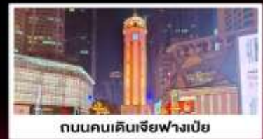
ถนนคนเดินเจียฟางเปี่ย