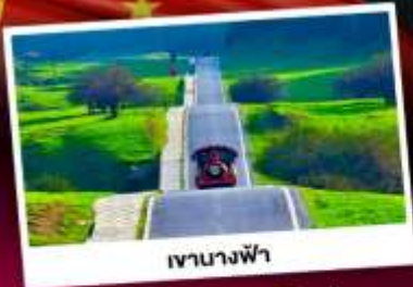
เขานางฟ้า