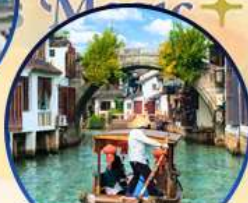
เมืองโบราณจูเจียเจีย