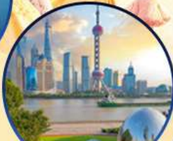
นอร์ทบิ้น กรีนแลนด์