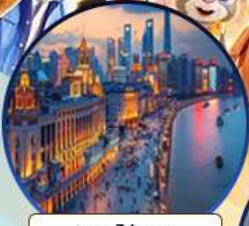
หาดไวทาน