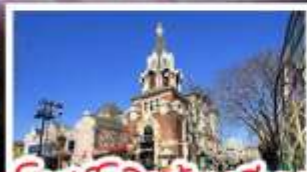
โบสถ์โกธิคตาเลีย่น