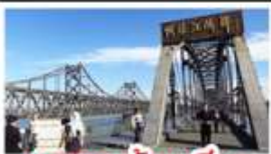
สถานางตัวนเมยิว