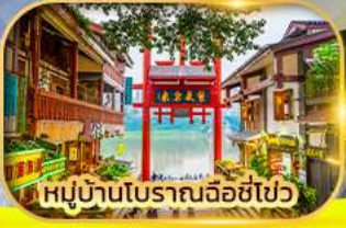
หมู่บ้านโบราณฉือซีไฉว