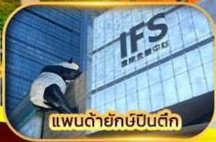
แพนด้ายักษ์ปิ่นตึก