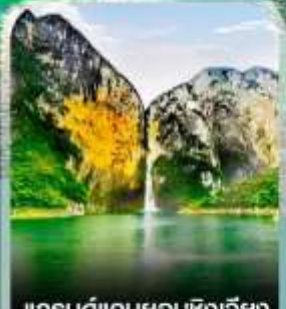
แกรนด์แคนยอนซิงเจียง