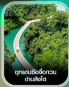
อุทยานซีจื่อกวน ด่านสิงโต