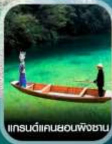
แกรนด์แคนยอนผิงชาน

คอนเฟิร์มออกเดินทาง ทุกพีเรียด 2 ท่านขึ้นไป