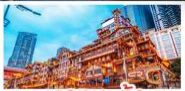
แวงเฉียวตัง