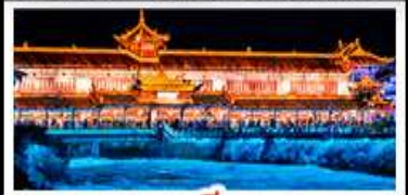
สะพานหนานเฉียว BLUE TEARS

สวนบ้านฮาว - อุทยานหลุมฟ้าสะพานสวรรค์ สีดรุณี - หงหยาดัง - รถไฟฟ้าทะลุติ๊ก สะพานหนานเฉียว BLUE TEARS พักโรงแรมระดับ 4 ดาว - ไม่ลงร้านช้อปปิ้ง เบบูพิเศษ สุกีหมาล่า เปิดปิกนิก