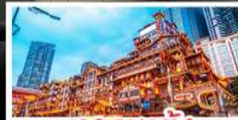
แสงฉายาตั้ง