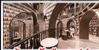
ร้านหนังสือจุกุ่กั๋ว