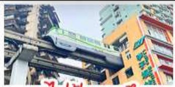
รถไฟฟ้าทะเลตึก