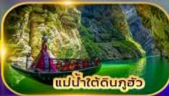
แม่น้ำใต้ดินกุ้ย