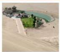
เขื่อนทรายหมิงซาซาน