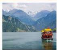
คลองเรือทะเลสาบเทียนฉือ