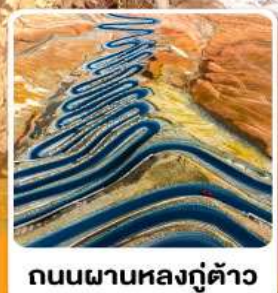
ถนนผานหลงตู้ต้าว