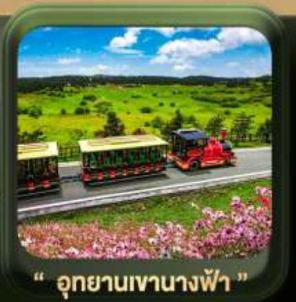
" อุทยานเขานางฟ้า "