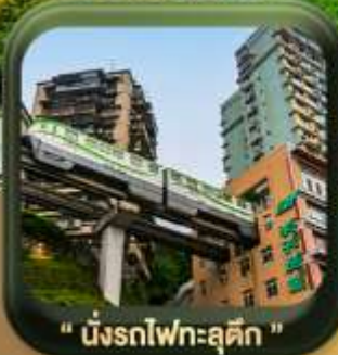
" นิ่งรถไฟทะลุตึก "

บินตรงลงหลงชิ่ง • อุ่หลง หลุมฟ้าสะพานสวรรค์ • ระเบียบแก้ว • อุทยานเขานางฟ้า หงหยาดัง • นิ่งรถไฟทะลุตึก • ศาลาประชาม (ด้านนอก) • หลงหมินฮ่าว มรดกโลกผาหินแกะสลักต้าจู้ • วัดหลิวอัน • ตึกตะเกียบ • ถนนคนเดินเจียฟางเป่ย์