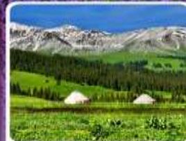
ทุ่งหญ้านาฬิกา