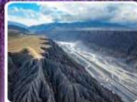
แกรนด์แคนยอนตูซานจื่อ