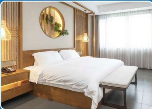
👤👤 DOUBLE (DBL)