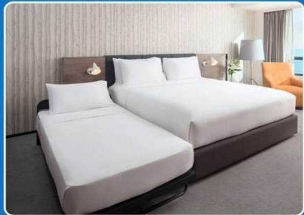
👤👤+👤 TRIPLE (TRP)

**รูปภาพห้องพักเป็นเพียงภาพสื่อถึงประเภทของเตียงเท่านั้น ไม่ใช่ภาพห้องพักจริงสำหรับการเข้าพัก**