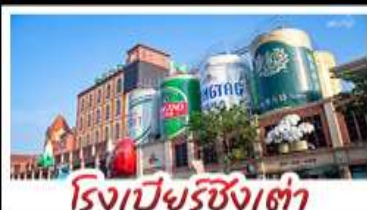
โรงเบียร์ชิงเต่า