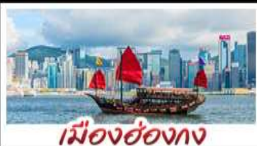
เมืองฮ่องกง

เมืองเก่าชิงเต่า - วิวเมืองอ่องกง โรงเบียร์ชิงเต่า - ท่าเรือชาวประมงเยียนโก