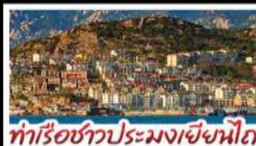
ท่าเรือชาวประมงเยียนโก