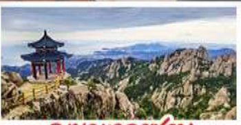
ภูเขาเหลาซาน