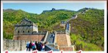
กำแพงเมืองจีนด่านจวิรงกวน