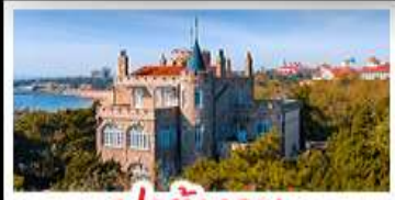
ป่าตึกวน

พระราชวังฤดูร้อน - วิวเมืองชิงเต่า รถไฟความเร็วสูง - ภูเขาเหลาซาน กำแพงเมืองจีนด่านจวิรงกวน - ป่าตึกวน พักโรงแรมระดับ 4 ดาว - ไม่หลงร้านช้อปปิ้ง มือพิเศษ เปิดปักกิ่ง , หม้อไฟซีฟู้ด