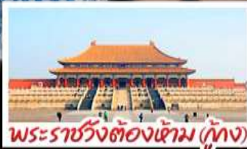
พระราชวังต้องห้าม (ทุ่ง)