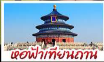
เอดฟ้าเทียนถาน