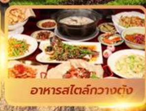
อาหารสไตล์กวางต้ง