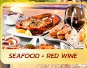
SEAFOOD + RED WINE