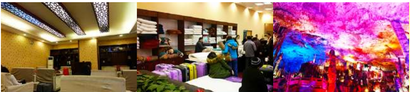
ศูนย์แพทยแผนจีน

อัตราค่าบริการสำหรับโปรแกรมเสริมการแสดงชุด The love Story of Wooden man and Fairy Fox ท่านละ 400 หยวน (หรือประมาณ 2000.-บาทขึ้นอยู่กับอัตราแลกเปลี่ยน) ระยะเวลาที่ใช้ในการเที่ยวชมการแสดง ประมาณ 3 ชั่วโมง รวมเวลา เดินทางไป กลับค่าบริการรวม ค่าบัตรเข้าชม ค่ารถรับ ส่ง และค่าน้ำดื่มของไกด์ท้องถิ่น