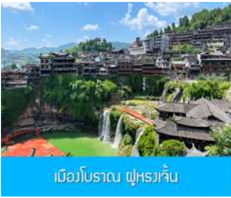
เมืองโบราณ ฝูหรงเจี้ยน