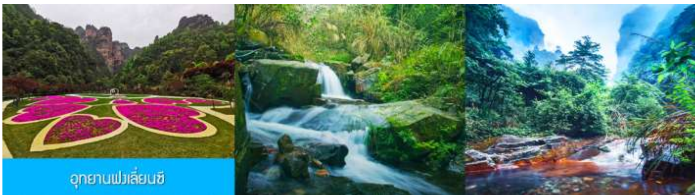
อุทยานฟงเลียนซี