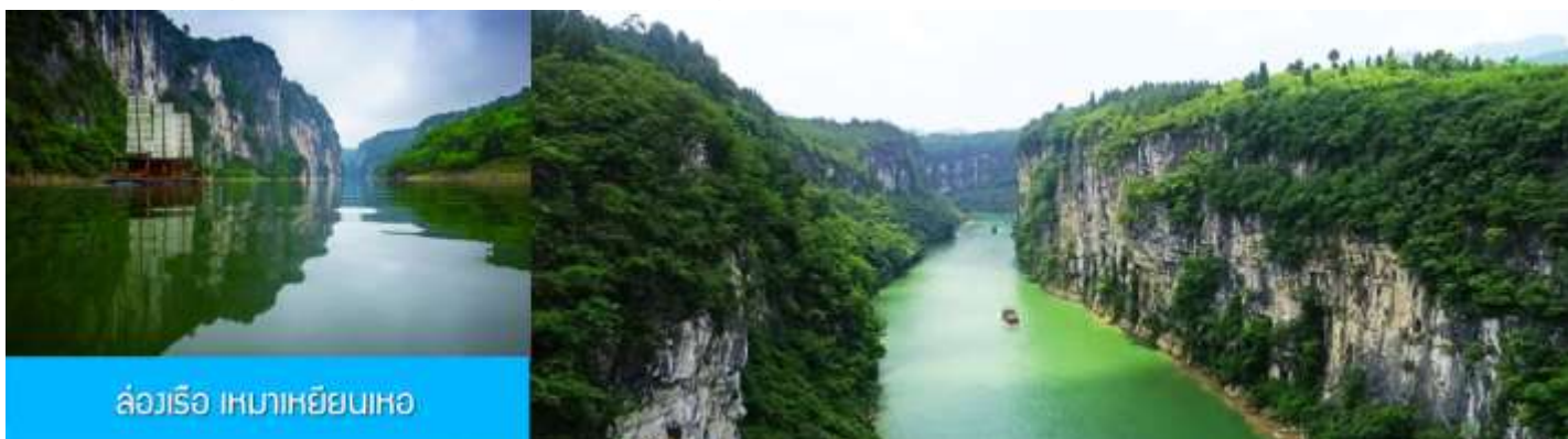
ล่องเรือ เหมาเหยียนเหอ