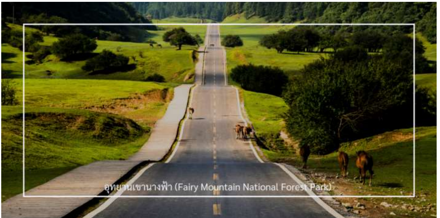
อุทยานเขานางฟ้า (Fairy Mountain National Forest Park)

นำท่านสู่ อุทยานเขานางฟ้า (Fairy Mountain National Forest Park) (รวมค่ารถไฟขบวนเล็กภายในอุทยาน) อุทยานเขานางฟ้า ตั้งอยู่ในเขตอู่หลง มหานครฉงชิ่ง ประเทศจีน เป็นสถานที่ท่องเที่ยวทางธรรมชาติระดับ 5A ของประเทศโดดเด่นด้วยภูมิประเทศแบบที่ราบสูงอัลไพน์ ปกคลุมด้วยทุ่งหญ้ากว้าง ป่าไม้เขียวขจี และยอดเขาสลับซับซ้อน สวยงามราวภาพวาด ด้วยบรรยากาศเย็นสบายตลอดทั้งปี ที่นี่จึงได้รับฉายาว่า “สวิตเซอร์แลนด์แห่งจีน” อุทยานครอบคลุมพื้นที่กว่า 330 ตารางกิโลเมตร มีระดับความสูงเฉลี่ยกว่า 2,000 เมตรจากระดับน้ำทะเล ท่านสามารถเพลิดเพลินกับการเดินเล่นชมธรรมชาติ ชมทิวทัศน์อันงดงามของภูเขา พร้อมบริการรถไฟขบวนเล็ก ที่จะพาท่านชมวิวม่านน้ำท่ามกลางธรรมชาติได้อย่างสะดวกสบาย