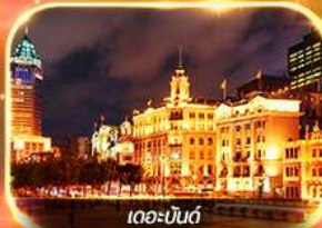
เดอะบอนด์