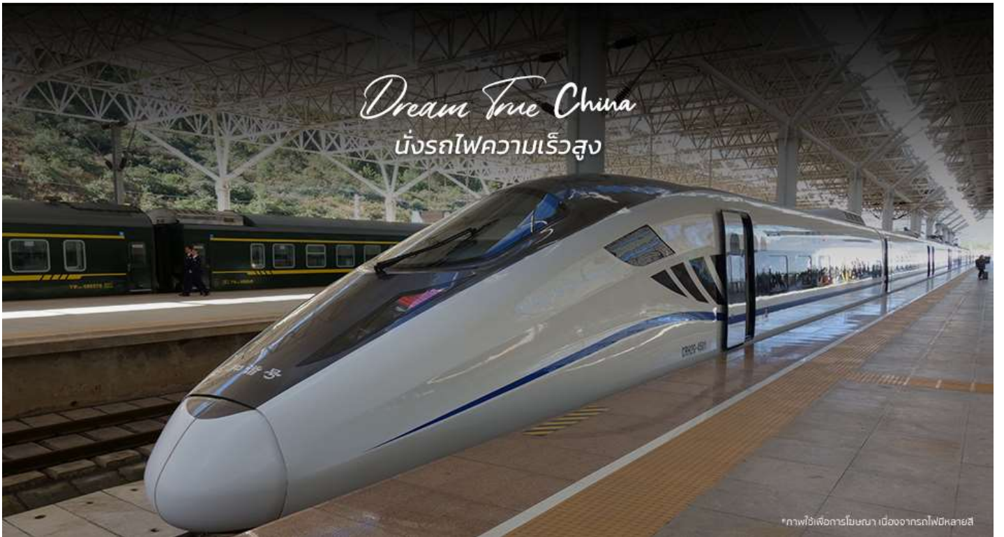
*ภาพไว้เพื่อการโฆษณา เนื่องจากรถไฟมีหลายสี

**ขบวนรถไฟอาจมีการเปลี่ยนแปลง** หมายเหตุ: เพื่อความสะดวกในการเดินทางของท่าน ทางบริษัทฯจะนำกระเป๋าดำเดินทางของท่านขึ้นรถบัส โดยท่านถือเฉพาะสิ่งของสำคัญ และจำเป็นขึ้นรถไฟความเร็วสูงเท่านั้น รถบัสจะนำกระเป๋าดำเดินทางของท่านไปจัดเตรียมไว้ที่โรงแรม