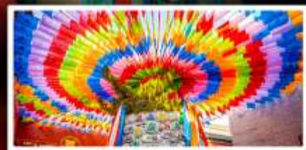
วัดลามะกว้างเหริน