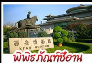
พิพิธภัณฑ์ซีอาน