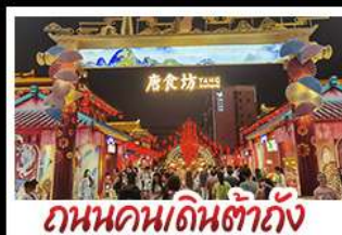
ถนนคนเดินต้าถิง