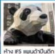
ห้าง IFS แพนด้าปิ่นตึก