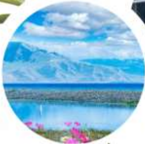
ทะเลสาบไซลีมี