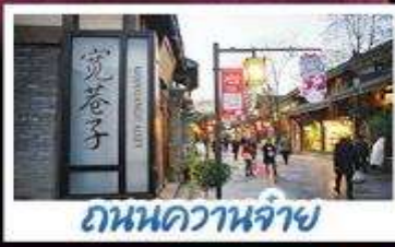
ถนนควานจ้าย