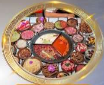
บุฟเฟต์ห่อมือไพลงซิ่ง