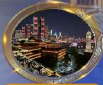
มื้อค่ำร้านอาหารวิหคหลักล้าน