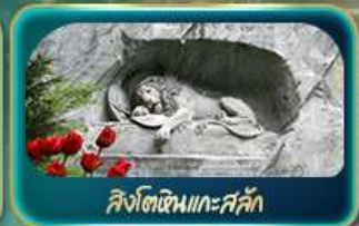
สิงโตหินแกะสลัก