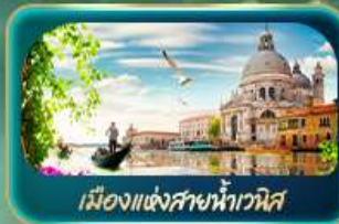
เมืองแห่งสายน้ำเวนิส

จุดบรรจบความอลังการของธรรมชาติ Dolomites และ ทะเลสาบมิซูรีน่า ชมน้ำสิเกอร์ครอยซ์ ทะเลสาบเบริยัส สุดโรแมนติกเมืองแห่งสายน้ำเวนิส ห้ามพลาด มหาวิหารดูโอโมแห่งมิลาโน โรมัน ฮาร์น่า บ้านของจูเลียต เที่ยวลูเซิร์น ชมสิงโตหินแกะสลัก เดินเล่นสะพานไมซ์าเปลา อินส์บรุค ย้อนอดีตกับเฮาเซนด์แอนน์ หลังคาทองคำ ซ้อปอูจ Outlet