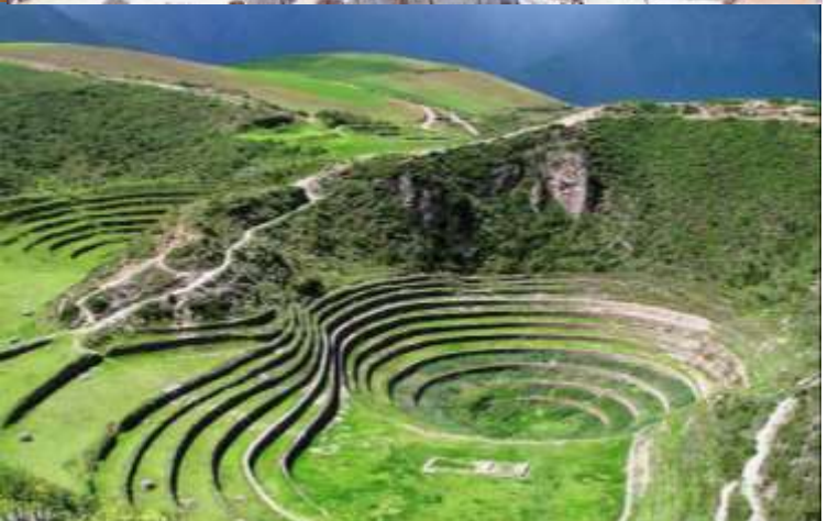
บ่าย นำท่านเดินทางสู่ มาราซ (Maras) แหล่งผลิตเกลือที่คุณภาพดีที่สุดในโลก ที่มีมาตั้งแต่สมัยอินคา แนวนาชั้นบันไดที่เรียงอยู่ตามลำดับความสูงของภูเขา จากนั้นเดินทางสู่ โมเรย์ (Moray) นาชั้นบนโดวงกลมขนาดใหญ่หลายวงรูปร่างแปลกตาที่ชาวอินคาทำไว้เพื่อทดลองปลูกพืชพันธุ์ต่างๆ จากจุดนี้สามารถมองเห็น หมู่บ้านอูรัมบัмба (Urubamba) ได้อีกด้วย ได้เวลาเดินทางกลับสู่เมือง เมืองคัสโก (Cusco) เมืองหลวงของอาณาจักรอินคา ที่แพร่ขยายอำนาจจนกินพื้นที่ 1 ใน 3 ของอเมริกาใต้ ตั้งอยู่เหนือระดับน้ำทะเลถึง 3,400 เมตร และเป็นแหล่งอารยธรรมยุคก่อนประวัติศาสตร์ที่ลึกลับน่าทึ่ง เป็นชุมชนเก่าแก่ของจักรวรรดิอินคาอันรุ่งเรือง ซึ่งยังคงทิ้งร่องรอยความเจริญไว้ให้เห็นเป็นซากปรักหักพังโบราณและโบราณวัตถุต่างๆ เย็น ที่พักรับประทานอาหารค่ำ ณ Tunupa Cusco Novotel Hotel Cusco หรือเทียบเท่า