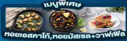
เมนูพิเศษ หอยแครง, หอยนางรม+วาฟเฟิล

พิเศษ ล่องเรือแม่น้ำเซน ชมเมือง โดย ชาโต มูซ