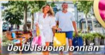
ป๊อปปิงโรมอนด์ ไอคาเล็ก