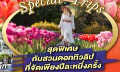
สุดพิเศษ กับสวนดอกทิวลิป ที่จัดเพียงปีละหนึ่งครั้ง