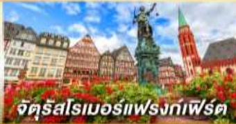
จัตุรัสโรเมอร์แห่งกัมเฟิร์ต