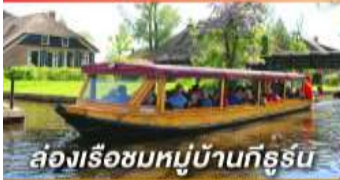
ล่องเรือชมหมู่บ้านกังหัน