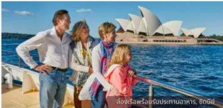
ล่องเรือพร้อมรับประทานอาหาร, ซิดนีย์