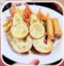
กุ้งสังกะสีสดรสชาตินิวซีแลนด์