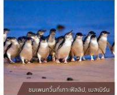
ชมเพนกวินที่เกาะฟิลลิป, เมลเบิร์น