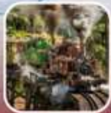
รถไฟทรานส์เมลเบิร์น