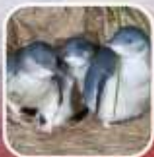
ชมเพนกวินที่เกาะฟิลลิป