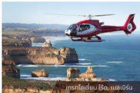
เที่ยวเฮลิคอปเตอร์, เมลเบิร์น