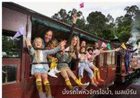
บั้งรถไฟหัวจักรไอน้ำ, เมลเบิร์น