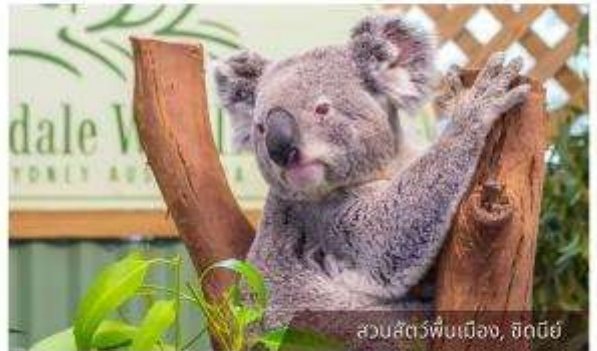
สวนสัตว์ฟีนเมือง, ซิดนีย์