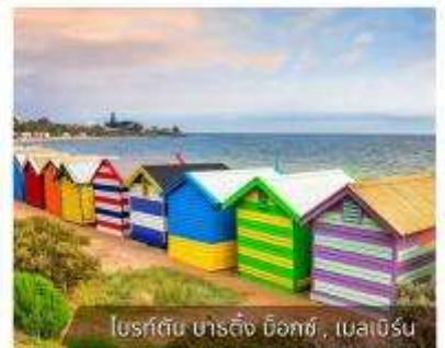
รีสอร์ตชายหาดบิชอปส์, เมลเบิร์น