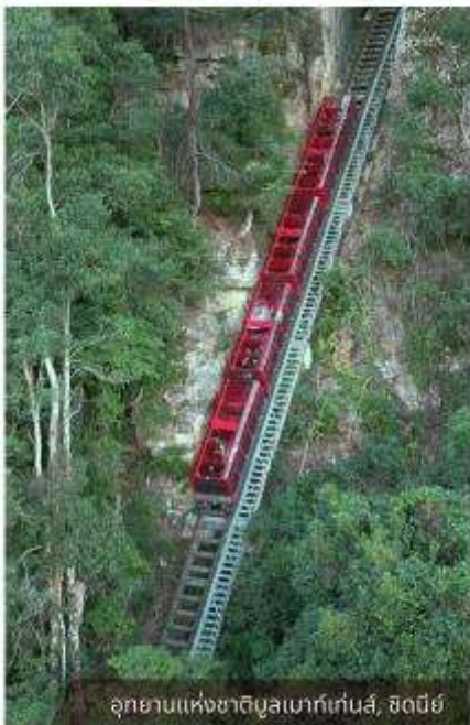
อุทยานแห่งชาติบลูเมาท์เทนส์, ซิดนีย์