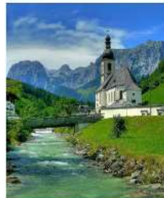
ออสเตรียบาวาเรียดินแดนแห่งเทพนิยาย

ออสเตรีย – บาวาเรีย (Austria-Bavaria) ดินแดนวัฒนธรรมเก่าแก่ที่ครอบคลุมสองประเทศและแทบแยกกันไม่ออกเลยว่าเราเที่ยวอยู่ในออสเตรียหรือเยอรมัน ท่านจะประทับใจไปกับหมู่บ้านเล็กๆน่ารัก ที่ตั้งอยู่บริเวณริมทะเลสาบในเทือกเขา “เยอรมัน-ออสเตรียแอลป์” พร้อมบริการอาหารรสเลิศและที่พักอย่างดีระดับ 4 ดาว หลูหรูที่เราคัดสรรมาให้ท่านได้พักผ่อนอย่างเต็มที่ให้การเดินทางของท่านคุ้มค่าที่สุดที่สุดในเส้นทางที่สวยงามที่สุดของออสเตรีย-บาวาเรีย