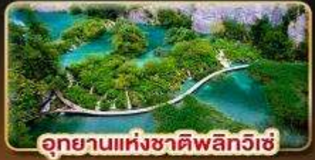
อุทยานแห่งชาติพลิตวิกิ