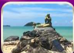
เที่ยวหาดสมิหลา สงขลา