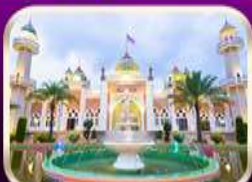
ชมมัสยิดกลางปัตตานี