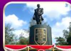
อนุสาวรีย์กรมหลวงชุมพรฯ