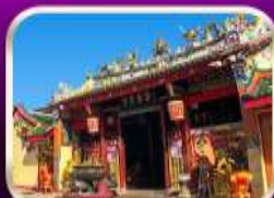
ศาลเจ้าแม่ลิ้มกอเหนี่ยว

ที่เที่ยวเพิ่มขึ้น และ ช่วยฟื้นฟูเศรษฐกิจขนาดใหญ่