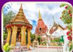
หอระฆังวัดพุทธาวาส วัดช้างให้